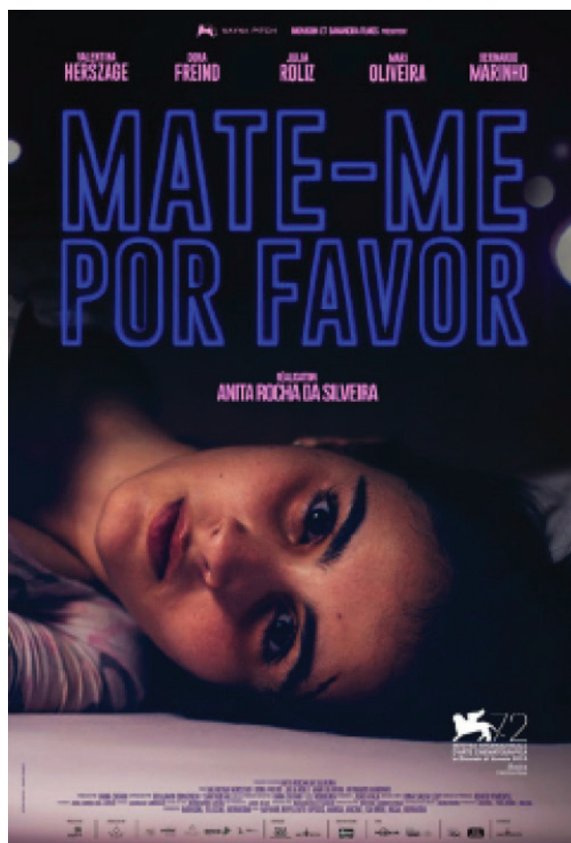
Afiche de Mate-me por favor , de Anita Rocha da Silveira (2015)

os realizadores ao término da exibição. E em todos esses três filmes, repetiu-se uma tendência do público em demonstrar certa frustração em não enxergar nas obras um incisivo discurso político; um alinhamento explícito a demandas ativistas da atualidade brasileira. No debate de Mate-me por favor , por exemplo, Anita Rocha da Silveira foi questionada sobre a falta de uma abordagem mais frontal em relação a questão do feminicídio e sobre a ausência de uma declaração abertamente feminista na obra.