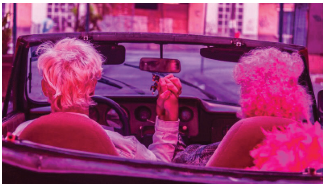
Fotograma de Os últimos românticos do mundo , de Henrique Arruda (2020)

Beaty define como fan service a tendência que criadores culturais vêm apresentando recentemente de “presentear os fãs com elementos narrativos que eles anseiam por ver.” 22 Prática bastante recorrente na cultura pop, comum de se encontrar em filmes da Marvel, seriados televisivos e mangás, o fan service oferece uma forte experiência catártica, na medida que concretiza em cena fantasias feitas sob medidas para os fãs do produto em questão. Sendo assim, acredito que fan service é outro termo que pode ser facilmente aplicado ao cinema político brasileiro de vertente otimista. Em Bacurau , o ponto de transição da narrativa, a cena que abre o terceiro ato, é o assassinato de uma criança, símbolo máximo do apelo emocional para o pagamento da catarse. É após essa morte que a cidade é propriamente atacada e o público pode assistir o povo guerreiro de Bacurau reivindicar sua vingança. E, como toda narrativa de vingança, o deleite catártico não se contenta em apenas matar, prática muito próxima da legítima defesa; é necessário que os inimigos sofram. Nas longas sequências em que os habitantes de Bacurau se vingam dos gringos através da violência e tortura, o espectador engajado em temas políticos experiencia um tipo de prazer aos moldes do experienciado por um fã de quadrinhos ao assistir Thor, Capitão América e Homem de Ferro reunidos em uma só cena. Através de suas experiências catárticas de fantasias revolucionárias, Bacurau oferece ao seu público um escapismo utópico