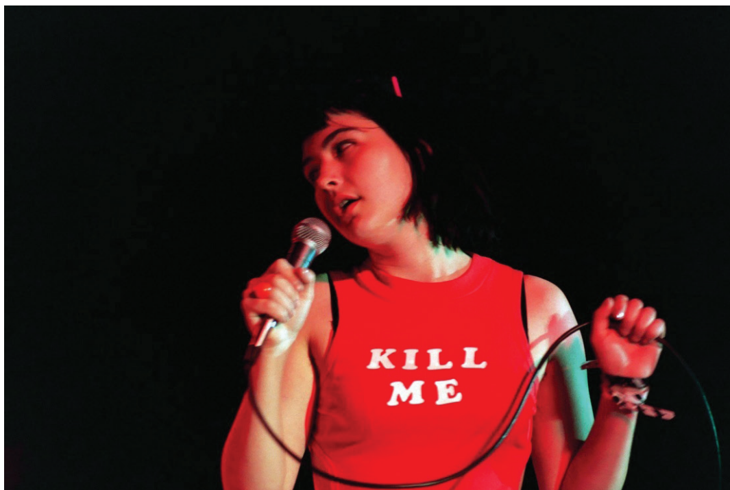
Figura 4: Kathleen Hanna e seu vestido com os dizeres KILL ME

banda punk Bikini Kill, em um show beneficente pela causa do aborto seguro em 1993. No registro, que se tornou um ícone da cultura pop, Hanna veste um vestido vermelho, feito por ela mesma, com os dizeres: KILL ME (ME MATE) . Ainda adolescente, quando consumia bastante música rock dos anos 1990, essa imagem me marcou de maneiras muito similares a abertura de Mate-me por favor . Em entrevista cedida para o portal The Cut em 2013, Hanna explica que sua ideia para o vestido partiu da reflexão sobre o que exatamente constitui “estar pedindo por um assédio”. “Se você usar um vestido que diz ‘me mate’ você está pedindo por isso?”, questiona ela. 33 A abertura do filme de Silveira ecoa essa mesma reflexão. Uma garota triste, solitária, bêbada, com roupas curtas que anda sozinha em uma rua escura e perigosa, está pedindo para ser violentada? Para além do alinhamento discursivo, o filme constrói uma imagem igualmente potente. Enquanto Hanna fez um show usando um vestido que em letras grandes e brancas nos diz ME MATE e essa imagem segue eternizada em fotografias até a atualidade, o filme coloca as palavras MATE-ME POR FAVOR, também em letras grandes e brancas, logo após o plano do rosto de uma mulher gritando em desespero e enquanto ainda podemos ouvir seus gritos. Além de ser o título do filme, a frase, dentro dessa decupagem, reveste-se do sentido alegórico de representar o “pedido” da mulher que grita antes de ser assassinada.