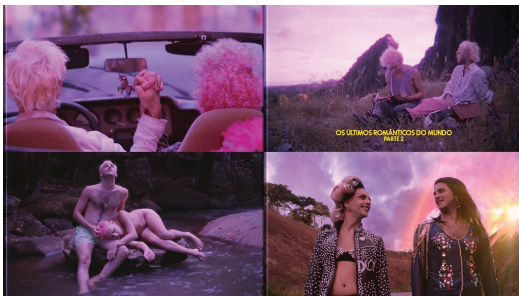
Figura 2: Momentos afetivos em Os últimos românticos do mundo . Henrique Arruda, 2020.

Ao longo da viagem, o casal principal explora diversos prazeres. Dublam canções, dançam, nadam, transam, se acariciam. Negando a busca por redensões e salvações utópicas, o filme estabelece de antemão a morte do planeta como uma inevitabilidade. Nesse contexto, a possibilidade de ativismo é justamente a formação de comunidade (ainda que uma comunidade de dois), de forjar parentesco (a criativa subversão do pedido de casamento que acontece horas antes do mundo acabar), de estar um com o outro, germinando o apoio e o afeto compartilhado no momento do fim.