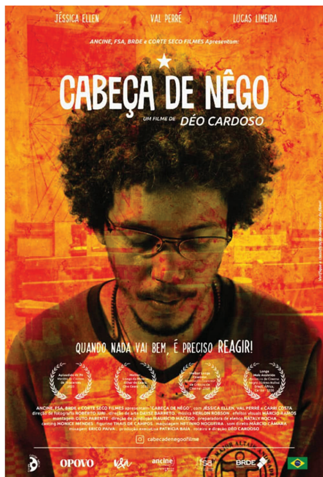
Afiche de Cabeça de nêgo , de Déo Cardoso (2020)

Um exemplo de filme brasileiro contemporâneo que se alinha a essa postura estética para construir seus discursos políticos, é o longa-metragem Sócrates (Alexandre Moratto, 2018), que retrata alguns dias na vida do personagem-título, um adolescente negro, gay e pobre que vive na periferia de Santos, litoral de São Paulo. Logo na abertura do filme, enquanto a tela ainda está escura, já podemos ouvir os gritos desesperados de Sócrates clamando por sua mãe. A imagem invade bruscamente o quadro e vemos o jovem, filmado por uma câmera bastante perto de seu rosto, tentando acordar a mãe, sem obter resultados. O filme se inicia com o garoto se tornando órfão e, desse momento em diante, assistimos o seu martírio ao passar por diversos tipos de violência, sempre com essa câmera opressiva, bastante perto de seu corpo em registro documental. Agressão física, homofobia, problemas com alcoolismo e desamparo familiar são alguns dos problemas reais que o filme nos exhibe. Até mesmo um breve romance que Sócrates vive com outro rapaz se torna rapidamente fonte de novos sofrimentos. Em um determinado momento, assistimos o garoto pegar um prato de comida