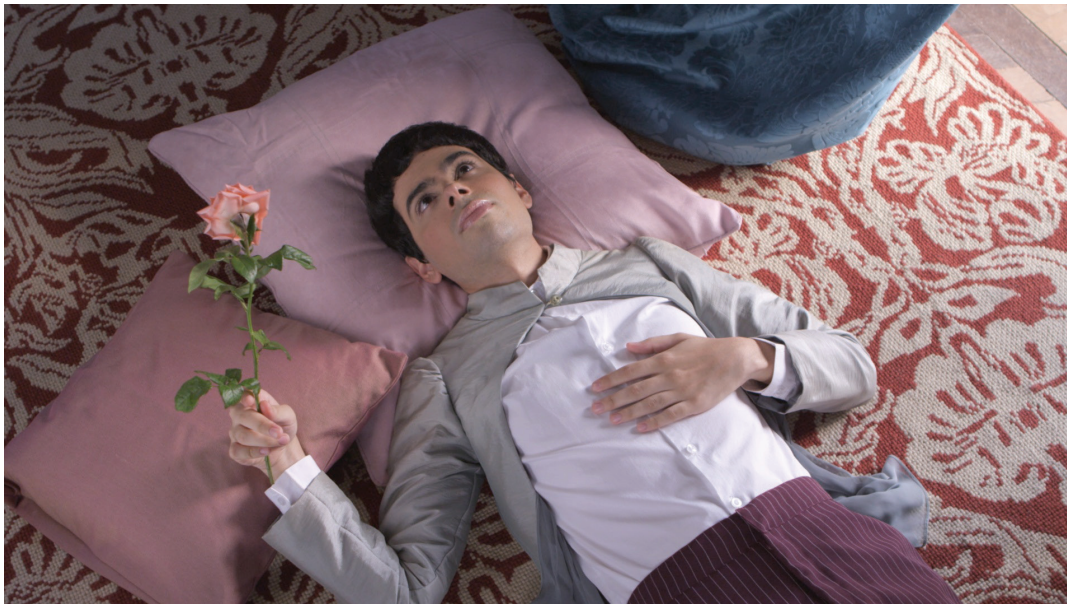
Fotograma de A seita , de André Antônio (2015)

Como postulado por Teresa de Lauretis, 28 percebo em todos esses filmes uma deliberada rejeição pela narratividade. Mesmo nos filmes mais tradicionais em termos de estruturas de roteiro, é notável caminhos de fragmentação da narrativa, momentos mortos, cenas que não contribuem para uma trama central. Em Mate-me por favor , provavelmente o mais tradicional dessa constelação, é feita uma digressão que consiste em um número musical, onde um grupo de alunos dança uma coreografia de funk sem que isso tenha alguma relação de causa e efeito com o todo do filme. Já em As boas maneiras , a ruptura que divide o filme em dois é um elemento que queerifica a sua narratividade. Não por acaso, essa quebra é um dos pontos mais criticados por crítica e público, que consideram que a segunda parte não se relaciona tão bem com a primeira.